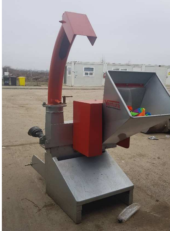
Figură 6 tocător vegetal tip VENTURA ATV 100