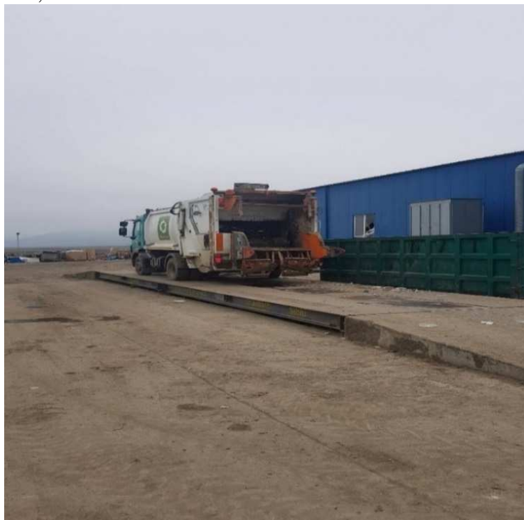
Figură 5 Cântar electronic pod basculă