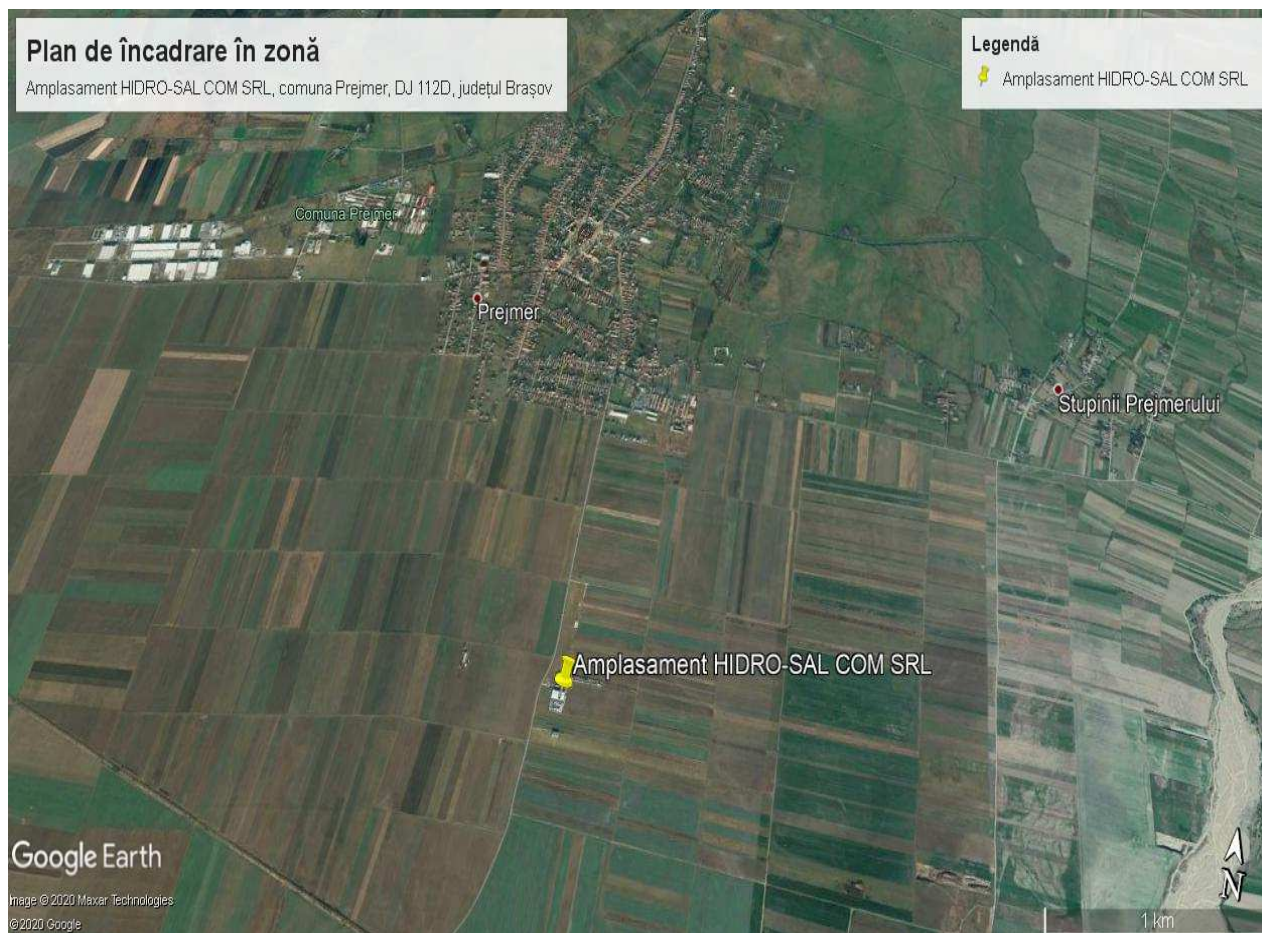
Figură 1 Localizare amplasament

HIDRO-SAL COM SRL desfășoară un management integrat al deșeurilor în aria de delegare ADI INTERSAL, conform următorului calendar: