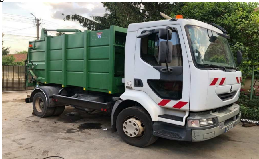
Figură 7: autogunoieră Renault