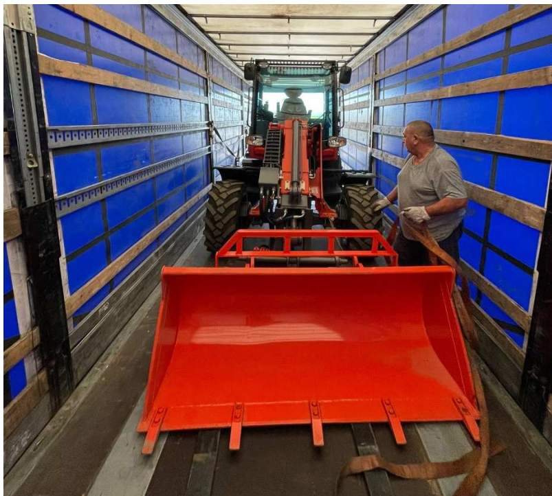
Figură 10: încărcător frontal