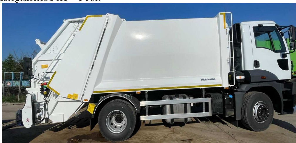
Figură 9: autogunoieră Ford