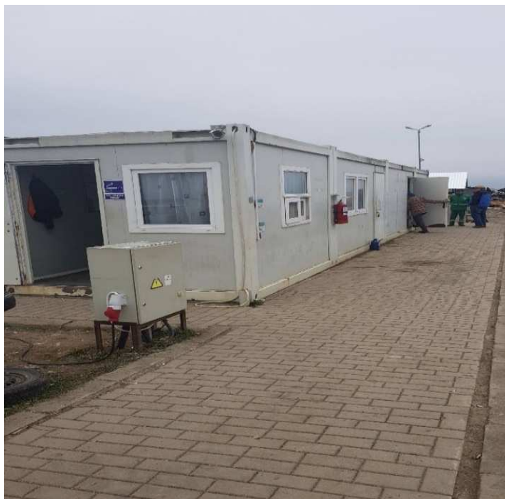
Figură 4 Cabină poartă, cabină cântar și pavilion administrativ