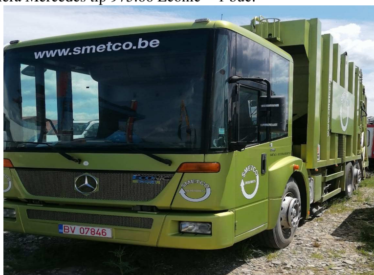
Figură 8: autogunoieră Mercedes-Benz