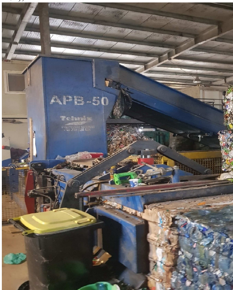
Figură 3 Presă Technix APB -50